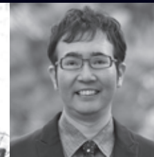
福岡伸一 生物学者 / 青山学院大学教授