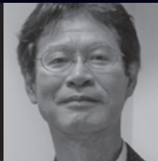
篠原資明 詩人・美術評論家 / 高松市美術館館長