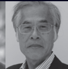
藤森照信 建築家 / 東京都江戸東京博物館館長